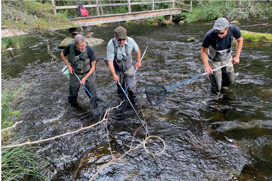
Bild 3. Elfiske i en av Bredforsens fina sidofåror i september 2025.

Förutom målarterna harr och öring har under projektet tio andra arter registrerats. Stensimpan är den art som, förutom de ovan nämnda, är mest typisk för strömmande vatten medan flertalet av de övriga är mer förknippade med miljöer som långsamt rinnande vatten och sjöar (gädda, mört, löja och abborre m.fl.). Förekomsten av övriga icke utpräglade strömvattenarter kan innebära ett problem för harr