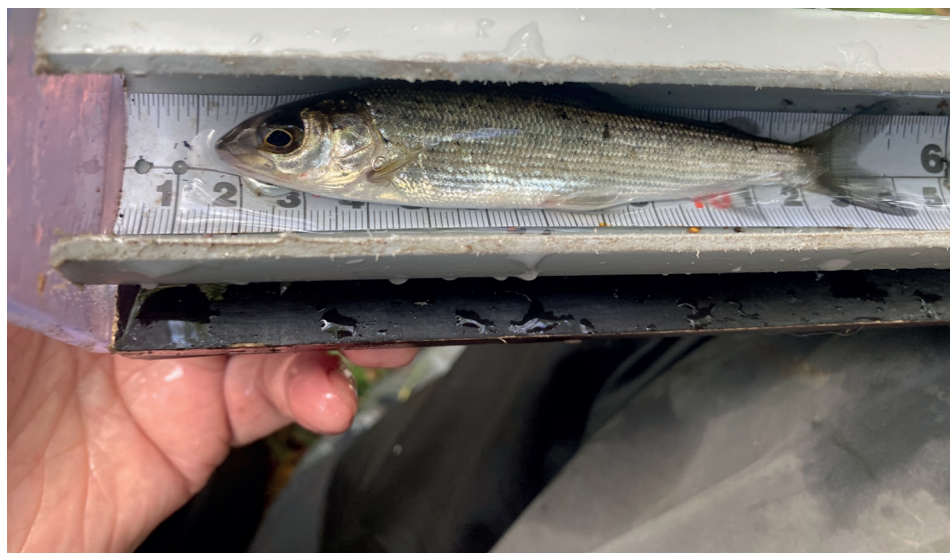
Bild 1. Årsyngel av harr som fångats på elfiske i Bredforsen i september 2025.

fångst. Höga vattentemperaturer under lång tid skulle kunna ha medfört att harren dragit sig ut mot svalare och djupare vatten.