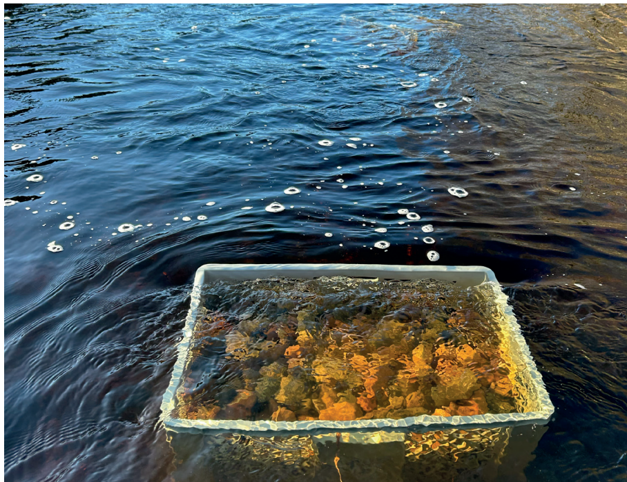
Bild 2. Utplacering av kläckbackar med befruktad havsöringsrom i nedre delen av Bredforsen i februari 2025. Arbetet utfördes av Söderfors-Hedsunda Fiskevårdsförening och Upplandsstiftelsen.

2011 kan med stor sannolikhet kopplas till den kraftigt ökade vattenföringen (ökad tappning) genom området vilket skedde bara någon dag innan provfisket började. En orsak till den anmärkningsvärt dåliga fångsten 2018 kan vara den långvariga värmen som lett till mycket höga vattentemperaturer under sommaren. Höga vattentemperaturer under lång tid skulle kunnat medföra att harren dragit sig ut mot svalare och djupare vatten. Sommaren 2019 var en mer normal sommar men trots detta uteblev harren utom på en av provfiskesträckorna, vilket är förbryllande. Sommaren 2020 präglades av värmebölja under andra halvan av juni, mer normalt sommarväder under juli och tämligen varmt väder under augusti. Vädermässigt kan sommaren 2021 karaktäriseras som relativt varm under juni och juli men med svalare förhållanden under augusti med stora nederbörds mängder. Sommaren 2022 karaktäriserades av relativt varmt väder, framförallt under hela augusti månad. Sensommaren både 2024 och 2025 var mycket varm och provfisket i Bredforsen bjöd på dagar med högsommarvärme och vattentemperaturer på ca 17-19 grader.