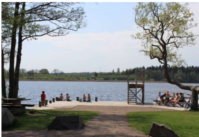
Första badplatsen med hopptorn.