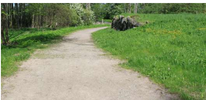
Grusad stig genom parken