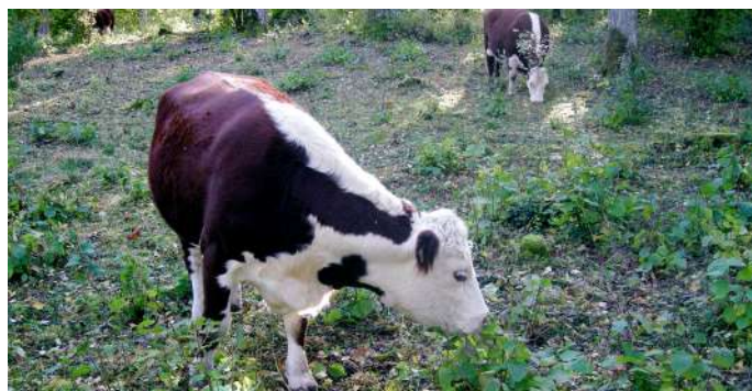
I hagarna i Wikparken betar kor och får.

Behandla djuren med respekt. Gå runt dem och håll hunden kopplad. Längs stigslingan Genvägen går du avskilt från kor och får.