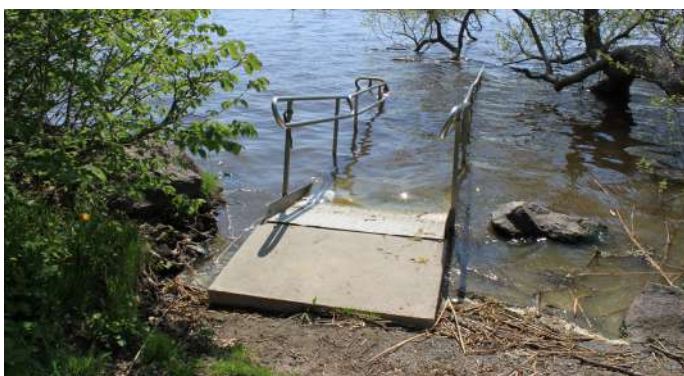
Ramp med räcken vid den tillgänglighetsanpassade badplatsen.