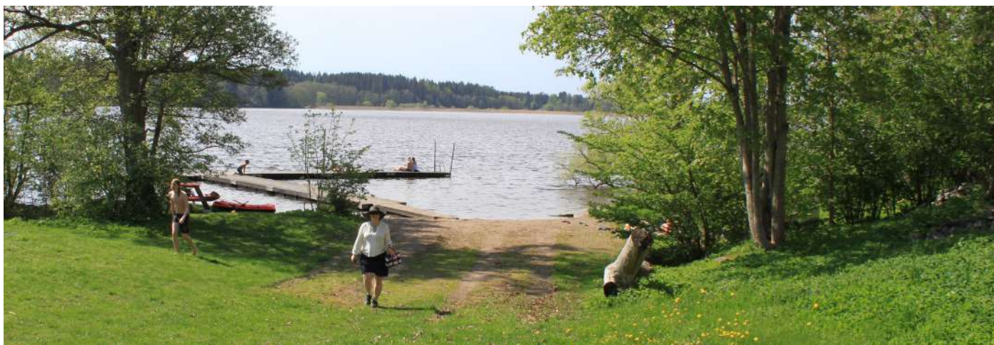
3. Badplatserna (bilden visar tredje badplatsen)