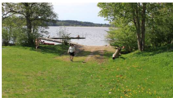
3. Badplatserna (bilden visa tredje badet)