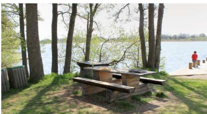
Bänkbord och i bakgrunden grillbord för engångsgrillar, vid första badplatsen.