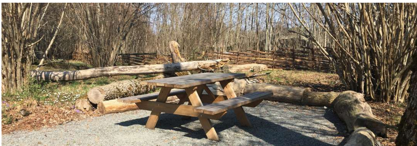
2. Rastplatsen på slätterängen