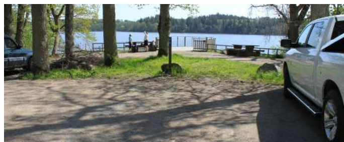
Handikapparkeringen inne i parken.