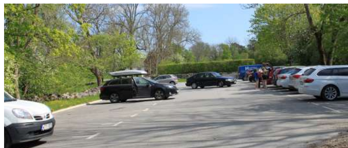
Stora parkeringen vid slottet.

Handikapparkering ligger vid plattformen inne i parken. Den är på hårdpackat grus med plats för fyra bilar. Här finns informationsskylt om området och vägvisare mot slätterängen. För att komma till handikapparkeringen följer du bilvägen förbi slottet och folkhögskolan, och vidare in i parken 900 m från den stora parkeringen.