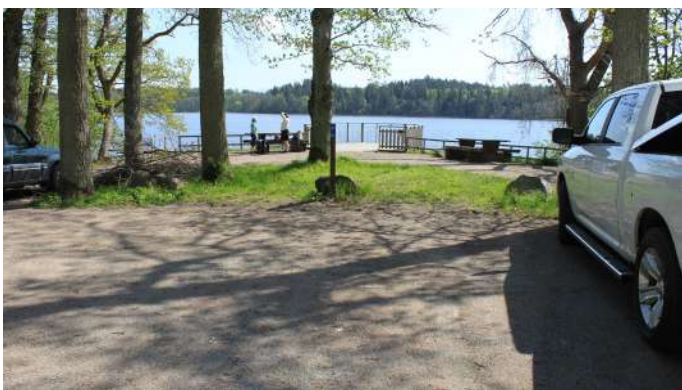
Handikapparkeringen nära plattformen.

Du kan också följa den asfalterade bilvägen, förbi slottet och vidare in i parken så kommer du så småningom till plattformen och handikapparkeringen.