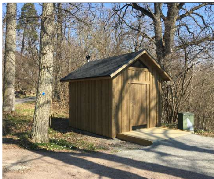
Torrtoalett i anslutning till plattformen