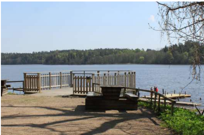
Plattformen i parken.

Från plattformen inne i parken får du fin utsikt över vattnet. Plattformen är bred och tillgänglighetsanpassad.