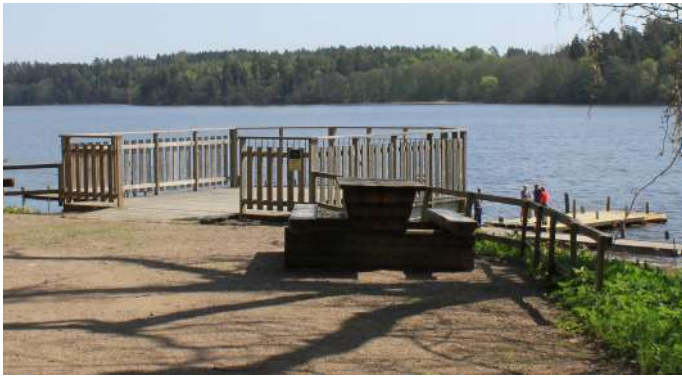
1. Plattformen i parken