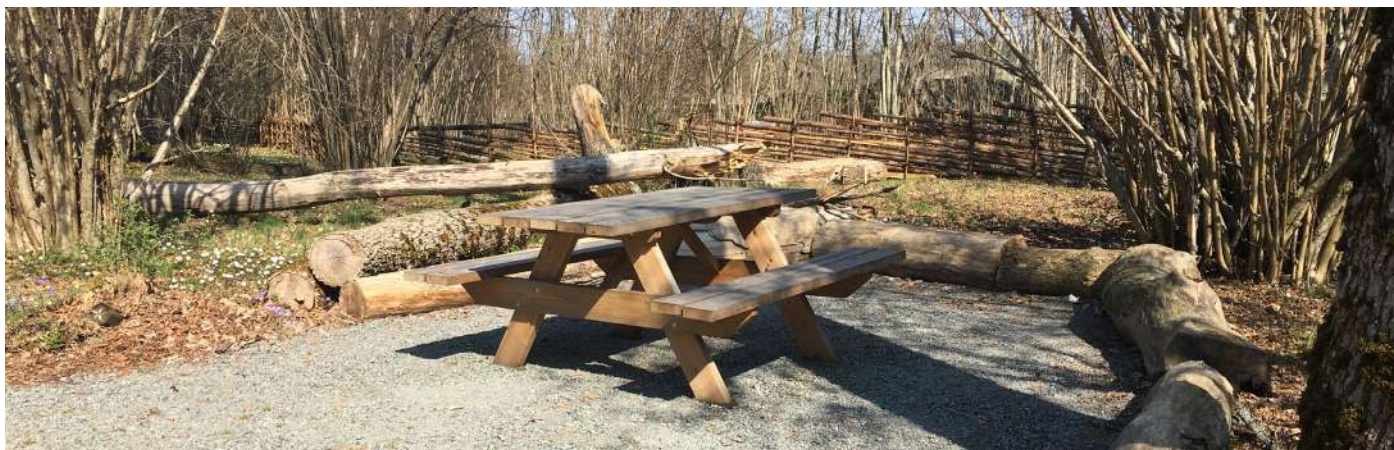
Rastplatsen vid slätterängen.