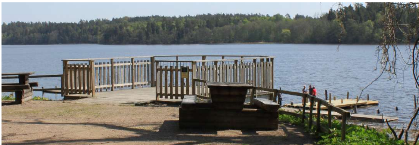
1. Plattformen i parken