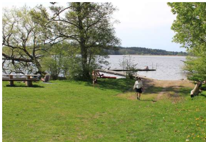
Tredje badplatsen med gräsytor bryggor och fikabord

Det finns tre badplatser nära varandra. Vid den första närmast slottet hittar du en hög brygga med hopptorn. Här finns ett grillbord för engångsgrillar och ett bänkbord som har förlängda sittytor på ena sidan, vilket underlättar när du ska sätta dig. Bordsytan är också förlängd så att rullstolar kan komma intill.