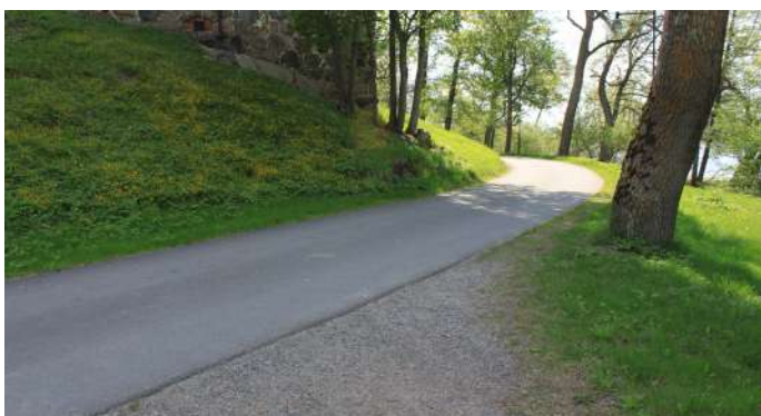
Grusad gångväg som övergår i asfalterad väg bakom slottet.