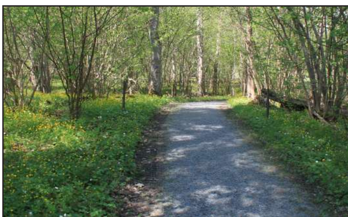
Grusad gångstig genom slätterängen.

I Wikparken finns en slätteräng som restaurerats för att släppa fram blommor hassel och ask. Vid slätterängen hittar du en rastplats med ett tillgänglighetsanpassat bänkbord. Underlaget runt om är hårdpackat grus.