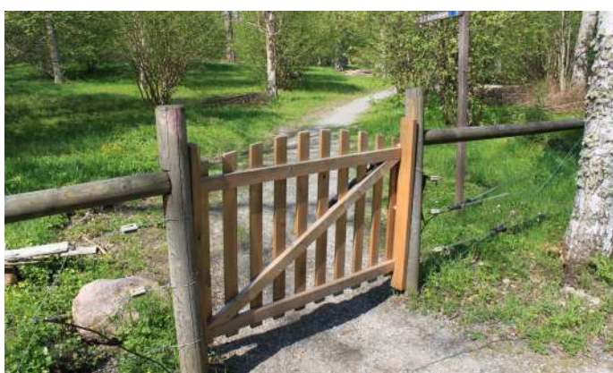
Självstängande grind in till slätterängen.