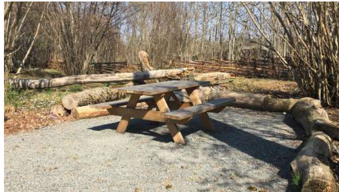
2. Rastplatsen på slätterängen