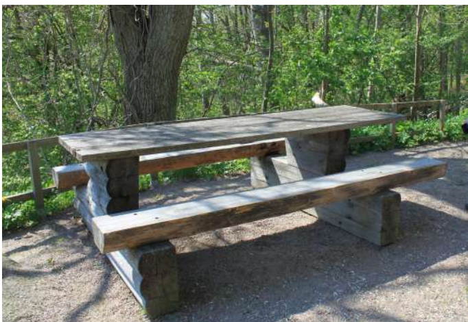
Bänkbord vid plattformen