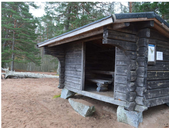
Vindskyddet vid badstranden