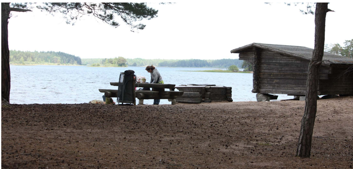
2 Östa stränder