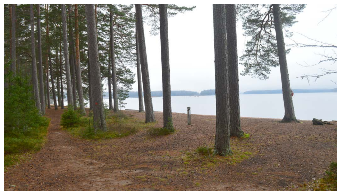
Första delen av stranden från stigen