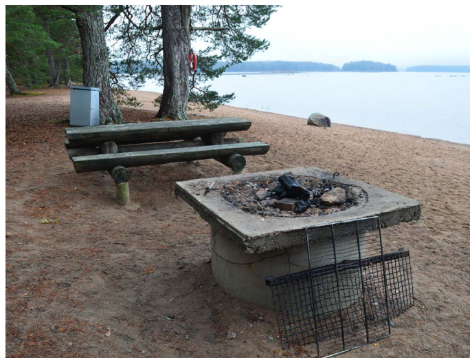
Grillplats och bänkbord på badstranden