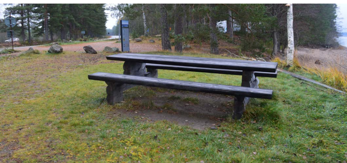
Stockbänkbord vid grillplatsen