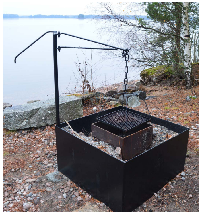
Grillplatsen med flyttbart grillgaller