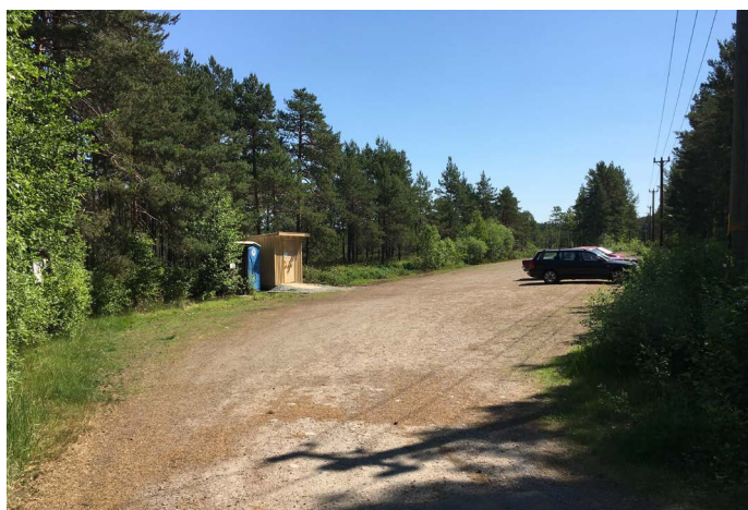
Parkeringen vid Stormossen

När du kommer fram till reservatsskylten fortsätter du rakt fram på vägen förbi Stormossens parkering. Efter 500 m passerar du Östa camping och strax därefter ligger parkeringen på höger sida. Parkeringen är mycket stor och är på hårdpackat grus. I södra delen på parkeringen finns informationsskylt om området. I norra delen av parkeringen finns det ett övergångsställe som leder till stigen mot Östa stränder.