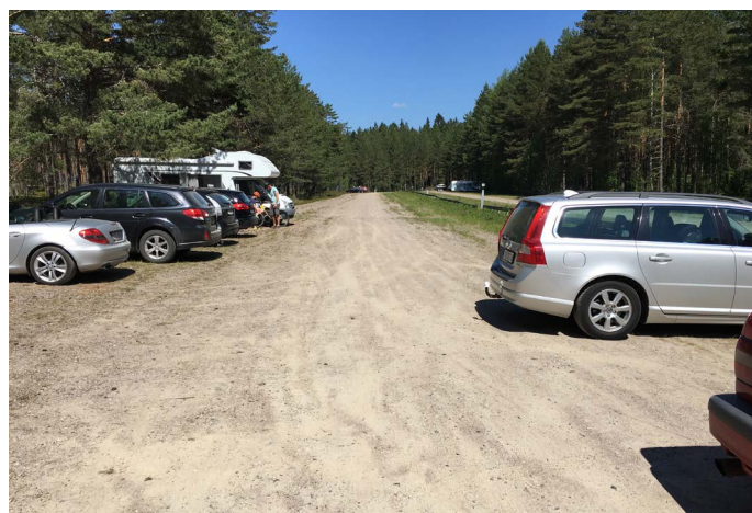
Parkeringen vid Östa stränder