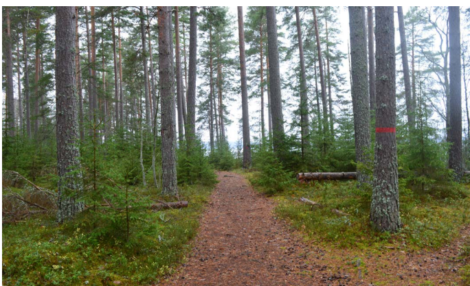
Stigen till stranden