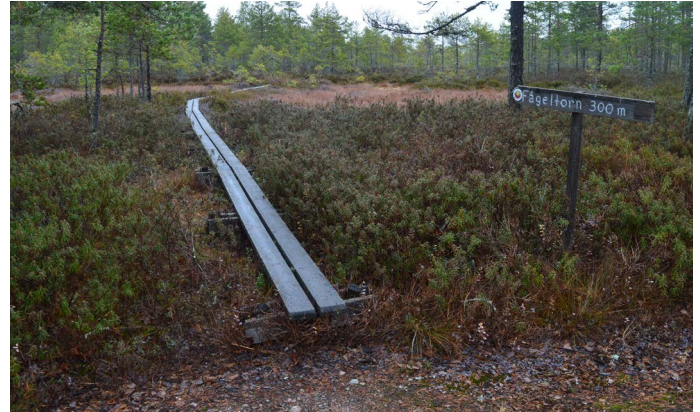
Stigen mot fågeltornet