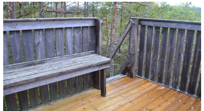
Bänken uppe i fågeltornet

Vid parkeringen finns en tillgänglighetsanpassad torrtoalett