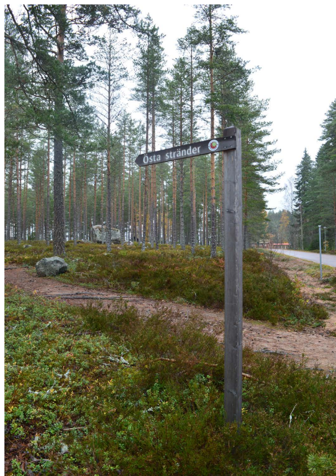
Skylden mot stranden

Stranden ligger 250 m från närmsta parkering. Gå över vägen vid övergångsstället i parkeringens norra del och följ vägvisaren mot smultronstället Östa stränder genom skogen. Stigen markeras med röd färg på träden. Stigen är bred men det finns mycket rötter och kortare sluttningar. Efter 250 m kommer stigen fram till stranden och en stolpe med texten "Östa stränder". Följ de röda markeringarna i ytterligare 200 m för att komma fram till vindskyddet och grillplatsen.