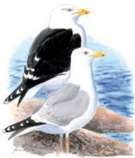
Havstrut och gråtrut

With this folder we want to guide you as visitors to some of the places on the island worth visiting. Places where you can discover the island's unique landscape and historical monuments.