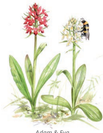
Adam & Eva

Vem eller vad skulle du själv vilja möta på Gräsön?