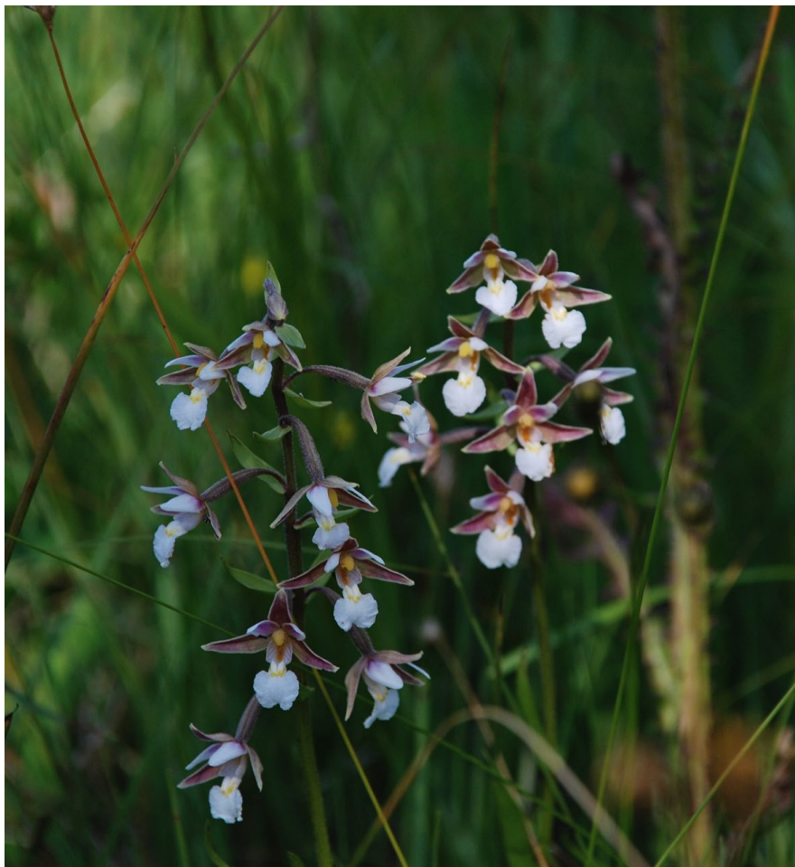
Kärrenknipprot växer i rikkärret Högmokällan.