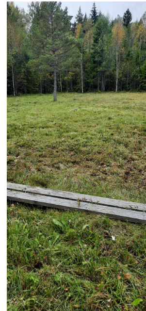
Kärret innan röjning i september. Kärret efter slåtter till höger.