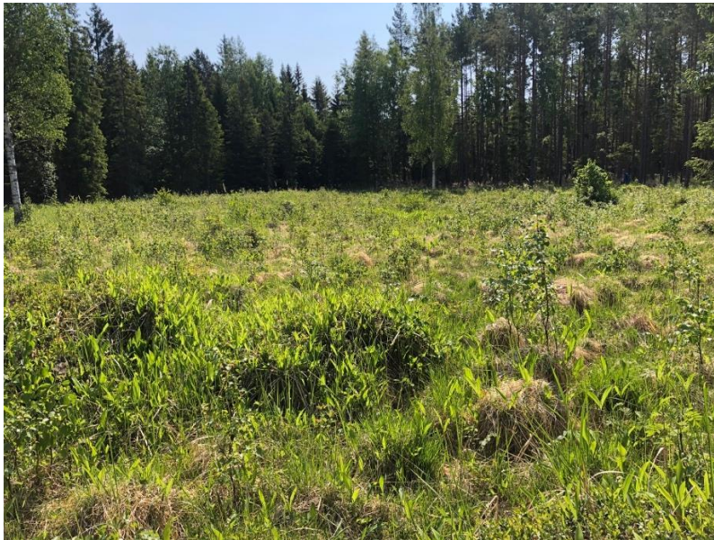
Rikkärret Forsängarna fotograferat den 14 juni 2023.

Markägaren Bergvik skog kontaktades och ett avtal skrevs mellan Upplandsstiftelsen och markägaren om tillstånd att få utföra skötselåtgärder av rikkärret. Under hösten 2023 utfördes så en røjning av kärret med ekonomiskt stöd från Länsstyrelsen.