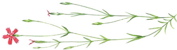
BACKNEJLIKA Dianthus deltoides