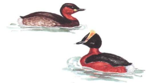
Smådoppingen och svarthakedoppingen : två sällsyntheter i kärret.

I början på 1800-talet dikades kärret ut för att öka på åkerarealen. De forna dikena kan fortfarande skönjas i kärrets centrala delar. Halvmeterdjupa hålor i kärrets mittparti vittnar ännu om att man tidigare grävt upp kalkhaltigt sediment som användts till jordförbättring på åkrarna. I början av 1970-talet höjdes vattenståndet en halvmeter för att gynna kärrets fågelliv.