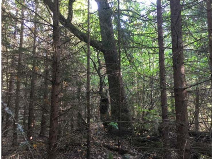
En av de ekar som hittades i samband med planeringen av åtgärder efter den genomförda inventering. Trädet frihöggs senare under hösten.