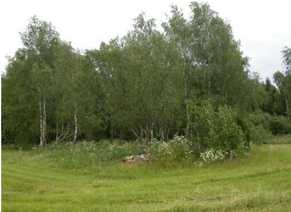
Figur 18 Lokal på Raggårön. På denna holme finns förutom gotlandssäfferotplattmalen även de två krisslesköldbaggarna Cassida murraea och C. ferruginea .