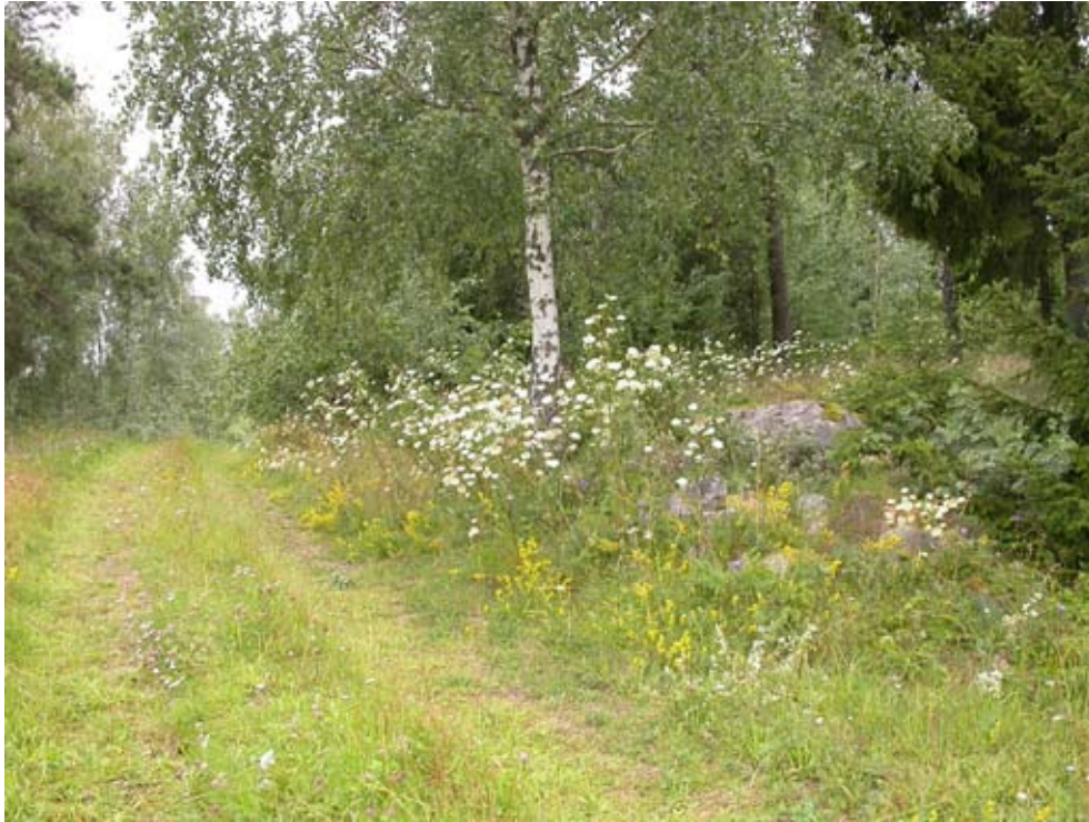
Figur 17 Lokal på Raggårön, Uppsala län

odlingar och delar av markerna betas extensivt med får och hästar, medan vissa partier står helt ohävdade. Under inventering sommaren 2007 hittades några få larver utmed en grusväg vid Söderökulla där säfferot fläckvis växer rikligt.