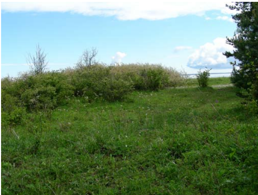
Figur 19 Typlokalen vid Liste ängar, Gotlands län

Typlokalen på Gotland utgörs av lövängar med en rik kalkgynnad flora (figur 19). På partiet närmast havet, där gotlandssäfferotplattmalen är påträffad, pågår en kraftig igenväxning med träd och buskar. Detta har sannolikt försämrat mikroklimatet, vilket möjligen förklarar artens minskning på lokalen.