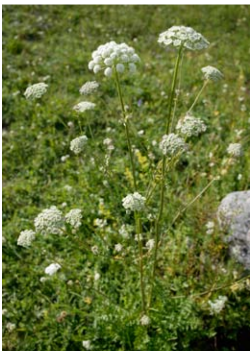
Figur 3 Säfferot

kan blomningen börja redan i juni och enstaka blommande plantor kan vissa år ses långt in i höstmånaderna. De tätt sittande något välvda blomflockarna har i början en vackert rosaaktig ton som med tiden bleknar och övergår i en vitare eller ljusare gul nyans (figur 3). Bladen är parflikiga och finludna. Säfferotens blad och rot har en aromatisk doft som liknar lukten av körvel ( Myrrhis odorata ). Säfferoten producerar en bladrosett som blommar när den blivit tillräckligt stor, i enstaka fall redan andra året, men oftare efter 3-5 år. Rosetten lagrar näring i en delvis förgrenad pålrot. Efter blomningen dör plantan. Säfferoten uppges vara självfertil, men är en av de mest besökta pollen- och nektarväxterna under eftersommaren. Säfferoten sprids sannolikt i första hand med frön, men vid grävningsarbeten i vägslänter och liknande kan förmodligen rotbitar följa med och etablera sig på tippningsplatser.