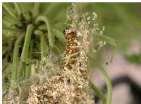
Figur 13 Larv av tvåfärgad morotplattmal