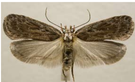
Figur 1 Gotlandssäfferotplattmal

Larven som hittills endast påträffats på säfferot Seseli libanotis är som vuxen slank, ljusgrön med tre mörkare gröna rygglinjer. Huvud och halssköld är ljus grön eller ljus brungul (figur 2). Larven är likt många andra plattmalslarver mycket livlig och kastar sig snabbt ut från sitt spinn om den störs alltför kraftigt.