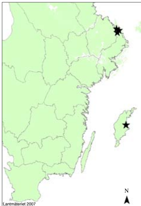
Figur 20 Utbredning av gotlandssäfferotplattmal