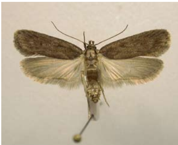
Figur 7 Dyster plattmal

Ytterligare några plattmalsarters larver utnyttjar säfferot som näringsväxt: