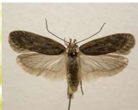
Figur 12 Säfferotplattmal