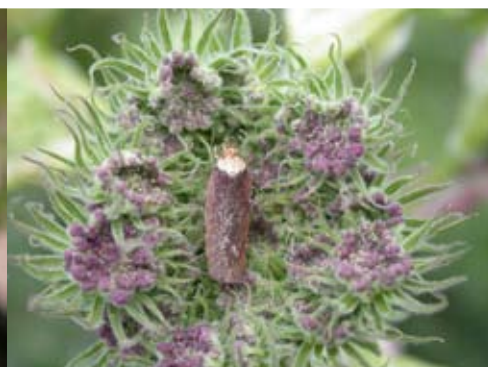
Figur 14 Tvåfärgad morotplattmal