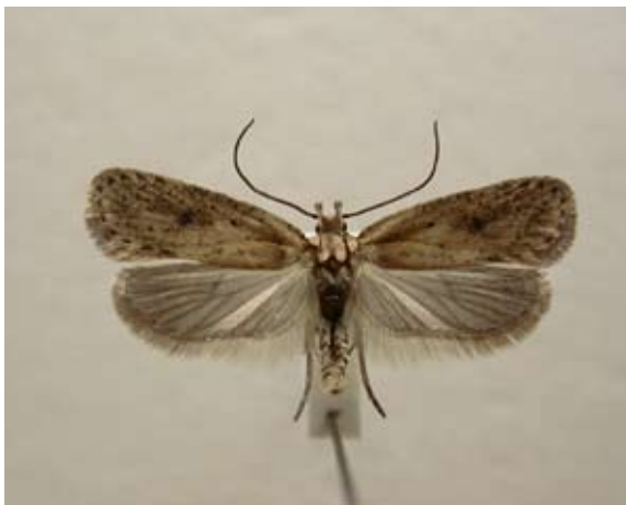
Figur 10 Fyrpunkterad plattmal