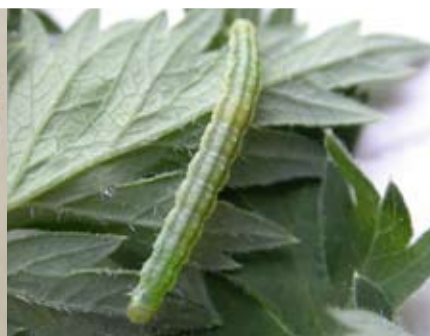
Figur 2 Larv

Säfferot ( Seseli libanotis L) är en flerårig ört som kan bli över en meter hög. Hela växten är hårig, har en grovt fårad stjälk och karakteristiskt borsthåriga frukter. Den har sin huvudsakliga blomningstid juli - augusti, men tidiga år