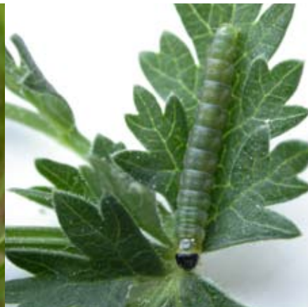
Figur 9 Larv av fyrpunkterad plattmal