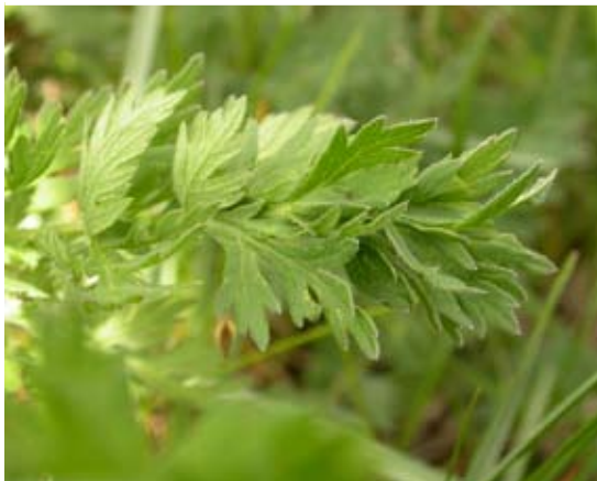
Figur 8 Larvspinn fyrpunkterad plattmal

från slutet av maj långt in i juni månad. Till färgen är larven enfärgat olivgrön med svart huvud och halssköld (figur 9). Den vuxna fjärilen är betydligt mindre än gotlandssäfferotplattmal med ett vingspann på 15 – 18 mm. Teckningen är mycket variabel, men arten saknar alltid de vita fjällen på vingarna och den vita mellankroppen och huvudet (figur 10).