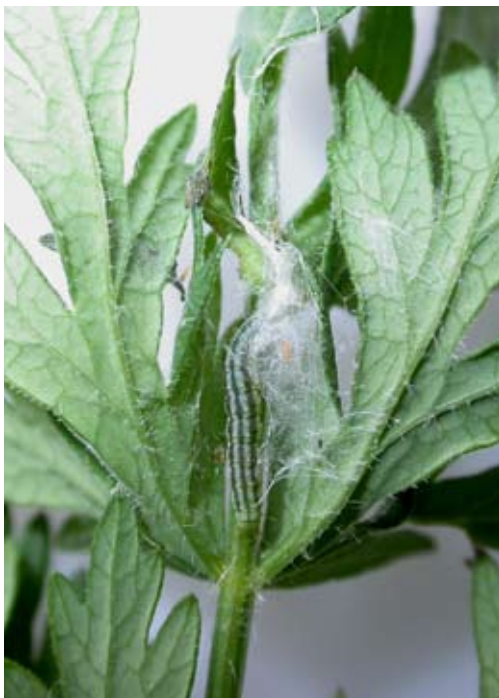
Figur 4 Larvspinn gotlandssäfferotplattmal