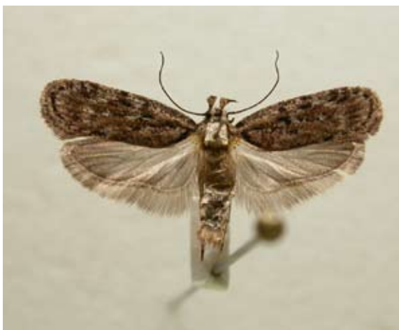
Figur 5 Ljusbröstad morotplattmal