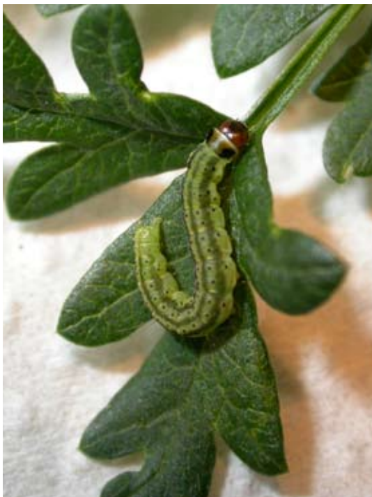
Figur 15 Larv av fransplattmal