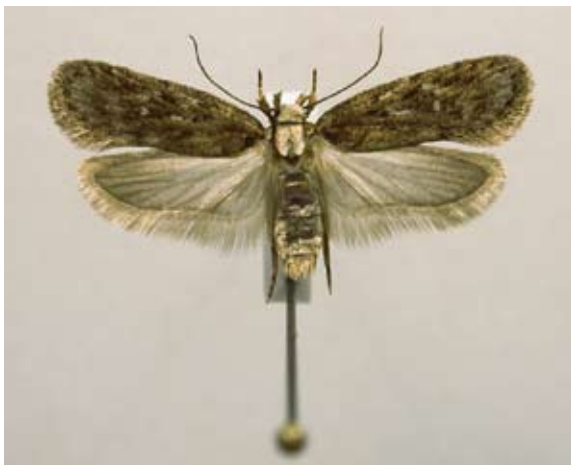
Figur 6 Ljusbröstad bockrotplattmal