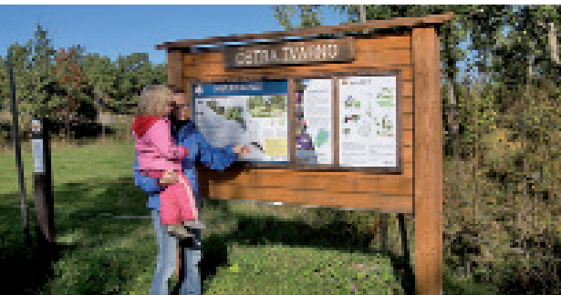
Vi går bort till hagen! På Östra Tvärnö i Östhammars skärgård finns blommorna nära och havet lite längre bort.

Ute i naturen finns det parkering, stigar och lite tips på vart man kan gå och vad man kan göra.