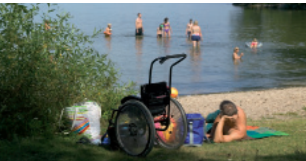
Med en lätt rullstol kan du komma till Äppelnäsgrund på Härjarö.