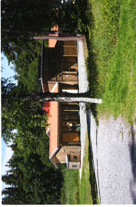
Servicehus med solvärmeanläggning