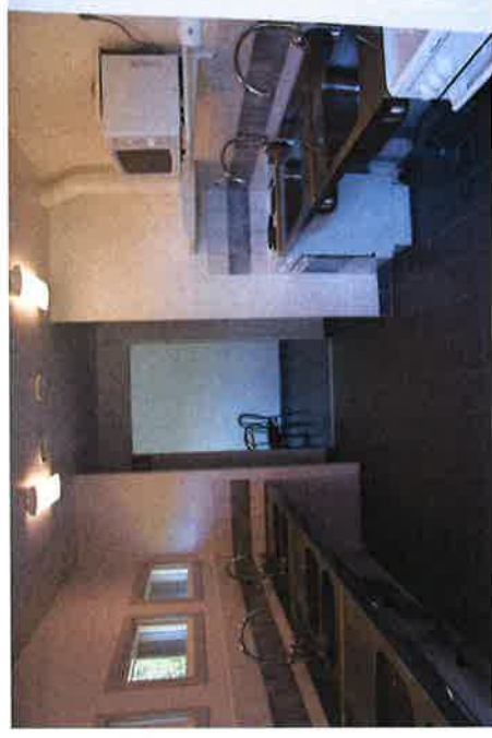
Interiör från köket i servicehuset

Servicehuset byggdes år 2010 och har kök, ett mindre samlingsrum, betalduchar, toaletter och tvättstuga enligt SCR:s rekommendationer. En solfångaranläggning med luftvärmepump och ackumulatortankar ger energi till uppvärmning och varmvatten i servicehuset. Familjedusch/toalett och handikapptoalett har separat värmeslinga och kan hållas uppvärmt vinterid utan att servicehuset i övrigt behöver hålla komfortvärme.