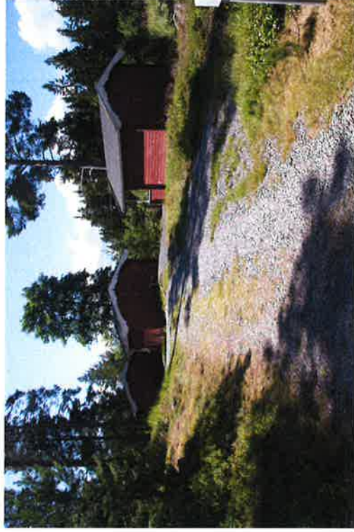
Reception med uteservering och kiosk. Tre campingstugor utan WC/dusch finns för uthyrning

Badstranden intill är en barnvänlig mindre havslagun med sandstrand och ska vara öppen för allmänheten. I reservatet finns en vedeldad bastu på udden öster om campingen. Här finns även möjligheter till bad från klipporna.