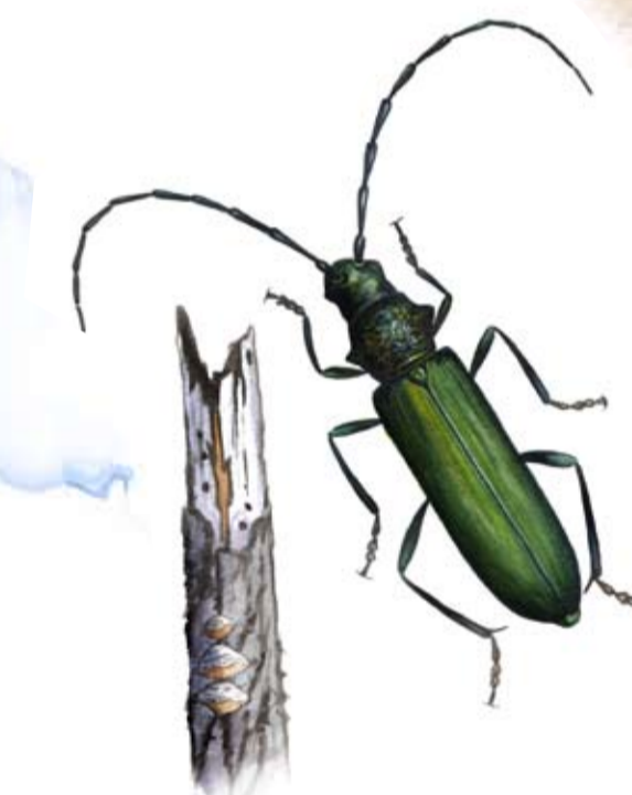
MYSKBOCK Myskbocken lever på äldre sälgträd och doftar behagligt av mysk.