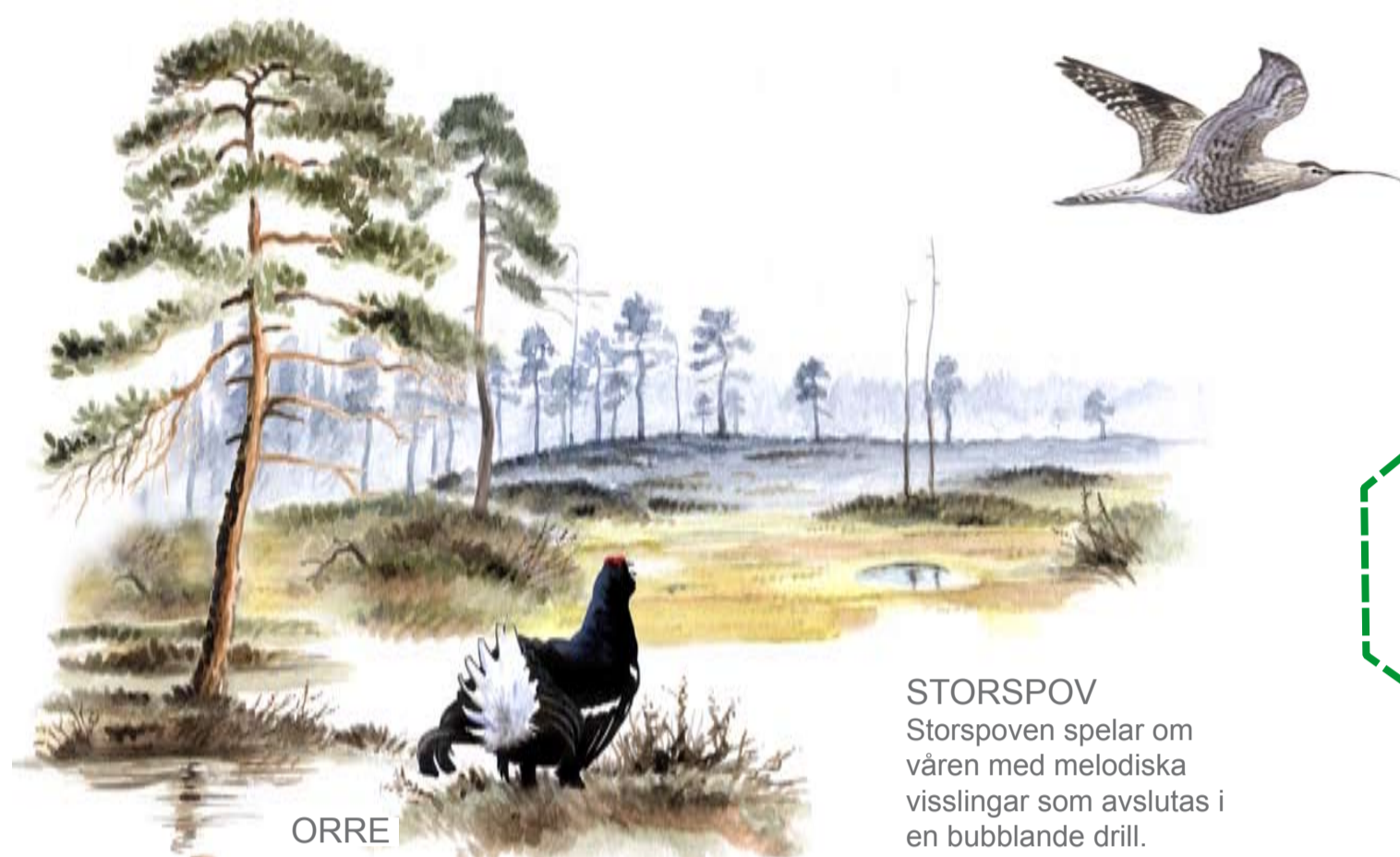
STORSPOV Storspoven spelar om våren med melodiska visslingar som avslutas i en bubblande drill.