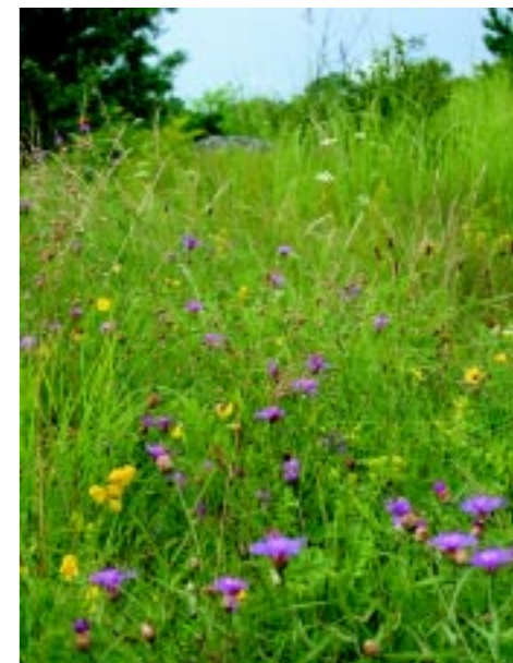
Både växter och pollinerande insekter gynnas om man släpper ut djuren sent på örtrika marker.

hagmarkerna är att jordbruken läggs ner. När betet upphör växer markerna igen och många växt- och djurarter försvinner. Det är med brukarna