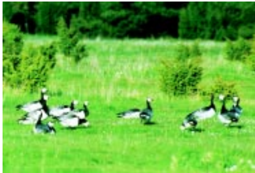
Gässen får viktiga rastplatser tack vare att betesdjur håller strandängarna öppna. Här en fjällgås bland vitkindade gäss.