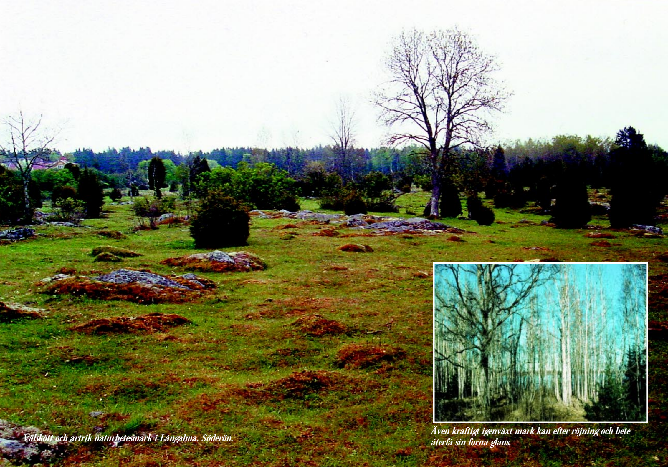
Välskött och artrik naturbetesmark i Långalma, Söderön.