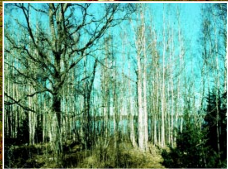
Även kraftigt igenväxt mark kan efter röjning och bete återfå sin forna glans.