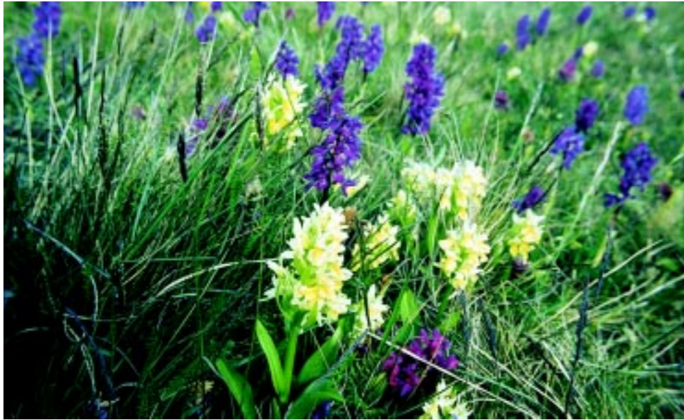
Adam och Eva blommor rikligt på försommaren på torra marker i Roslagen.