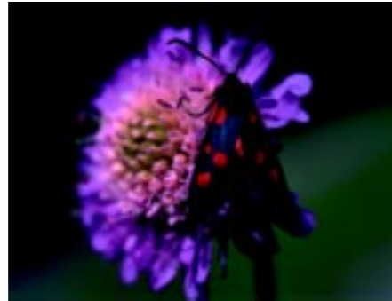
Ser du denna fjäril, en bastardsvärmare, får du gärna höra av dig. Den visar på marker med höga naturvärden.

Hagmark: Här avses ogödslad hagmark, s k naturbetesmark, som i modern tid inte heller plöjts eller på annat sätt förändrats. Naturbetesmarkerna är bland de mest artrika naturtyperna i Sverige – och en av de mest hotade.