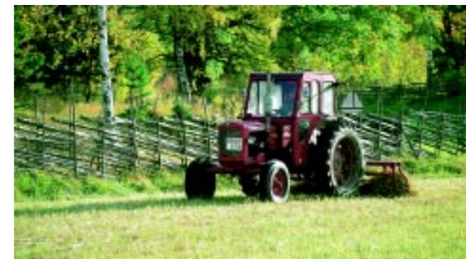
Gärdesgårdar är en kulturhistorisk stängselform vi värnar om. Slätter på Lönnholmen, Gräsö.

och betesdjurens hjälp som den biologiska mångfalden och det öppna landskapet kan räddas!