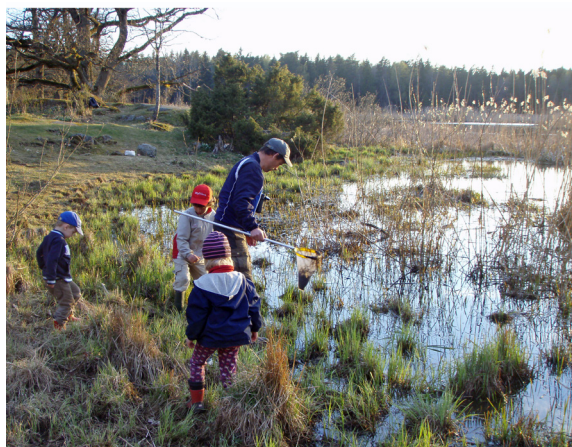
Våtmarken är hem åt många insektsarter. Den är ett spännande utflyktsmål för barnfamiljer.

För att anlägga eller restaurera en våtmark kan man få ekonomiskt stöd från Jordbruksverket. Man söker stöd för denna miljöinvestering hos länsstyrelsen. Man kan få upp till 90% av de stödberättigade kostnaderna, men högst 200 000 kr/hektar. Våtmarken ska ligga på jordbruksmark eller ha koppling till jordbruksmark.