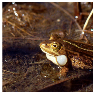
Gölgrodan finns i Sverige bara längs norra Upplandskusten. Den trivs i små grunda våtmarker utan rovfiskar.