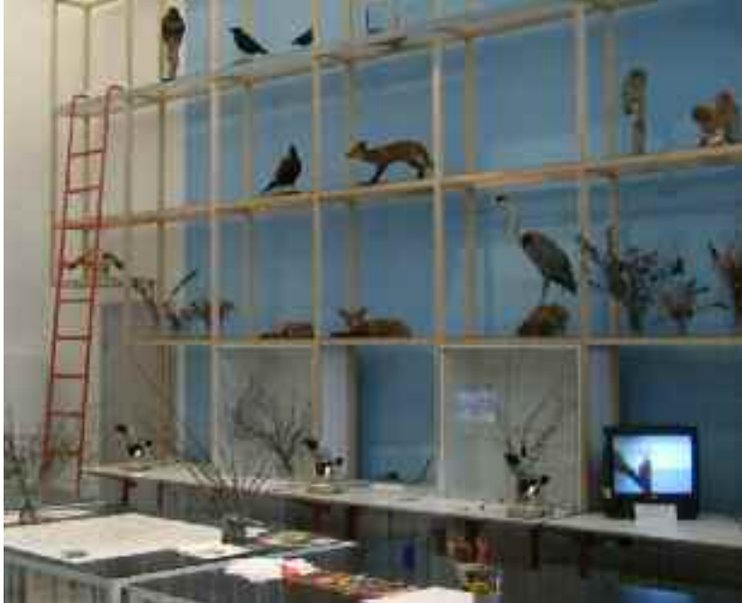
På Biotopia möts hundraåriga utställningar och modern teknik. Fascineras av djuren eller besök biolabbet.

Efter lunch strömmar en mellanstadieklass in genom dörrarna. Läraren har bokat både aktivitet och guidning med fokus på geologi. Halva klassen börjar med utställningen på nedervåningen, "En uppländsk tidsresa". Här får de bli och höra om var på jorden Uppland låg för 500 miljoner år sedan och vilka spår vi kan hitta från den tiden. Andra halvan av gruppen är i Biotopias biolabb där de tittar på bergarter och mineral. Barnen får själva undersöka olika mineral för att komma fram till vad det är.