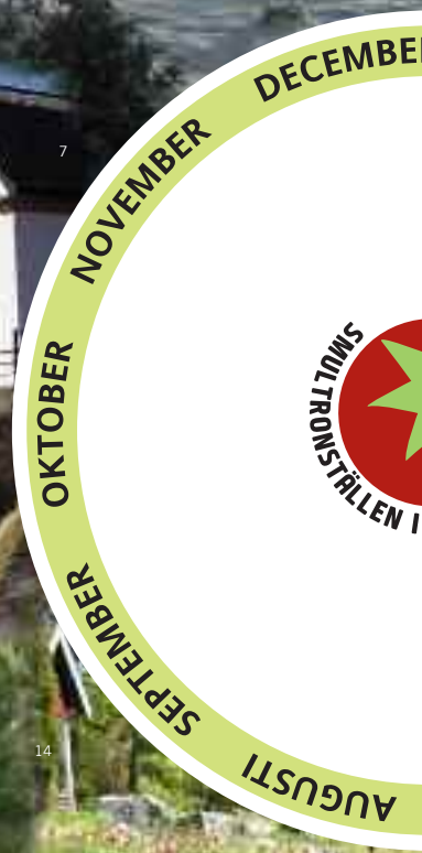
Titta på Adam och Eva vid Gräsö gård.