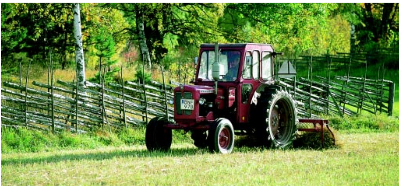
På Lönnholmen på Gräsö sköts fortfarande kulturmarkerna traditionellt. Traktorslätter har ersatt lien, men fortfarande underhålls 7 km (!) trögärdesgård och får betar i hagarna.

Stiftelsens erfarenhet som initiativtagare och projektägare utvecklas successivt. Detta är viktigt, då det i