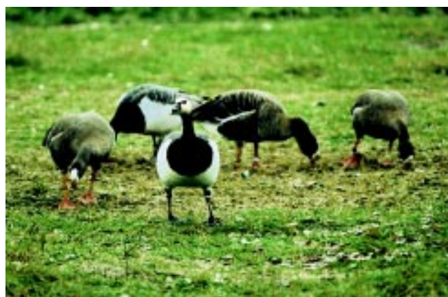
Fjällgås och vitkindad gås rastar gärna på fina strandängar.

På sikt ska uppbyggandet av ett antal ”Smultronställen” göra landskapet mera tillgängligt för länsinvånarna.