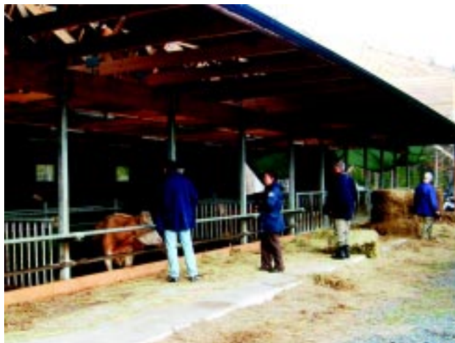
Roslagshagar har bidragit till planering och finansiering av tre djurbyggnader.

Ett maskinsamarbete har startats på Gräsö för att mer effektivt kunna ta vinterfoder till djuren. Nu kan fler djur hållas över vintern och därmed fler värdefulla naturbetesmarker betas.