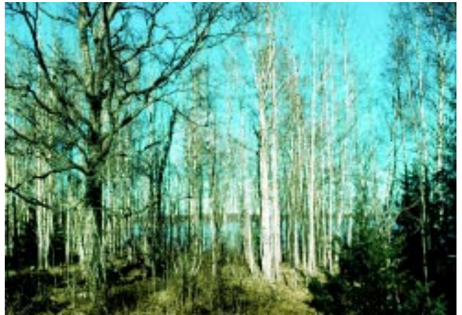
När betesdjuren försvinner förbuskas landskapet snabbt.

Samarbetet sträcker sig även utanför länet. I flera EU finansierade projekt samverkar vi med kollegor i bl a