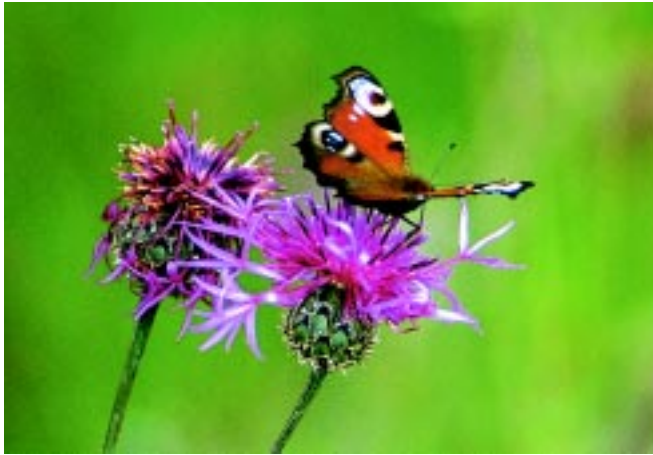
Påfågelläga födosöker på rödklint.