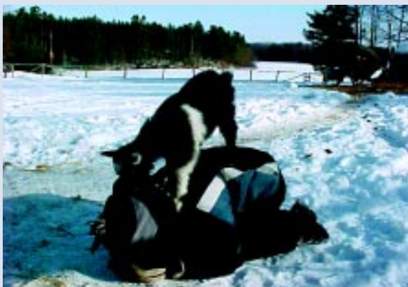
Öppet hus på naturskolan. Här är vår killing Askungen som älskar att leka med barnen.

Att det händer något speciellt i mötet mellan barn och djur är uppenbart. Tillsammans med djuren måste man ta det lugnt, umgänget med djuren måste ske på djurens villkor. Man får vara mjuk även om man egentligen är ”jättetuff”. Barnen känner sig behövda. Det är alltid många som vill bära vattenhinken eller höet, många vill mata och göra fint.