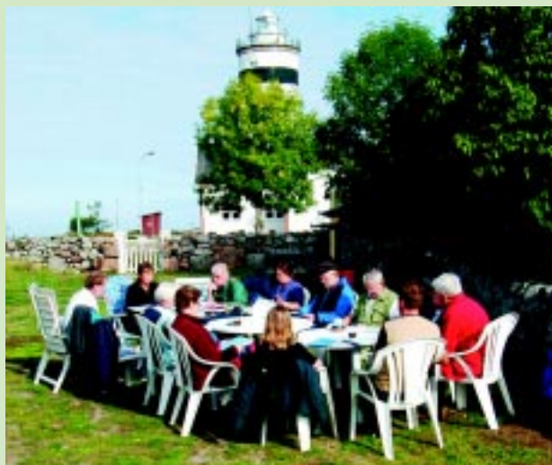
Sammanträde med Gräsöfondens styrelse.

Genom arbetet i Gräsöfonden har flera ansökningar om EU-medel beviljats genom åren. Under perioden 2003 till 2006 har fonden beviljats 2,6 miljoner kronor via EU-regionfond Mål 2 Öar samt regional medfinansie-