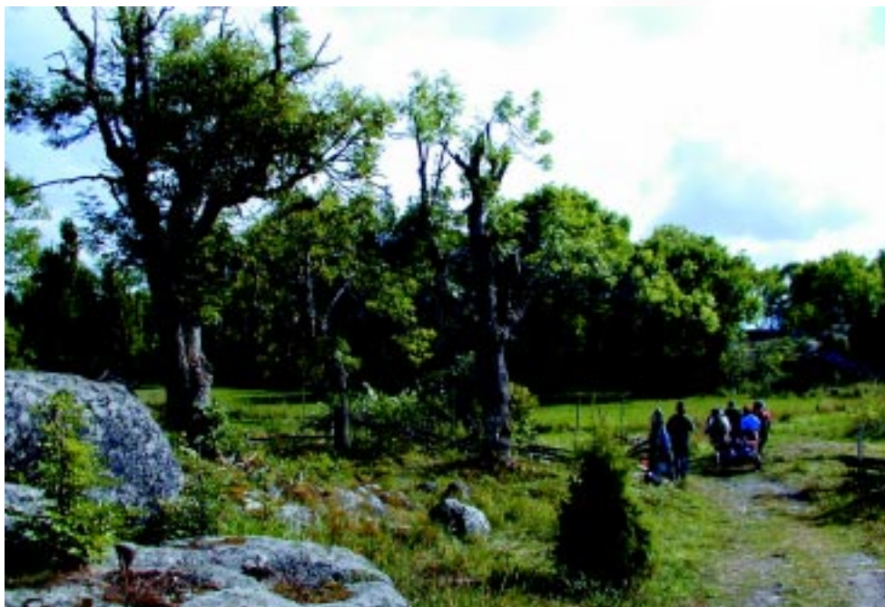
På Rävsten har de gamla träden åter blivit hamlade.

Restaureringar pågår i området genom att gran huggs bort runt gamla ekar och tallar.